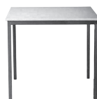
Tisch 80 x 80 cm