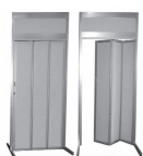
Koje absperrbar 1 x 1 m