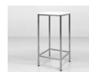
Stehtisch weiß 50 x 50