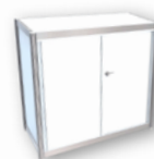
Infopult, 98 x 99 x 49,5 cm